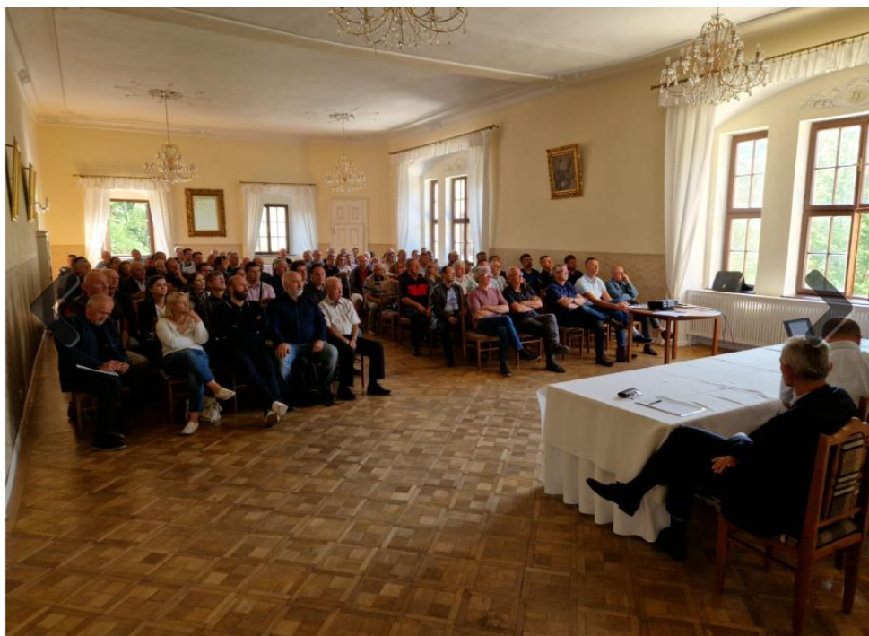
Obr.1 Rokovanie regionálneho stretnutia vo Fričovciach

Druhým najvýznamnejším zdrojom informácií sa podľa vyjadrenia členov sú regionálne stretnutia. Ich absencia v uplynulých rokoch je nenahraditeľná. Predstavenstvo preto kladie osobitný dôraz na ich prípravu. Regionálne stretnutia sa uskutočnili v mesiacoch jún a september – 17.6.2022 v Banskej Bystrici (kraj Banskobystrický a Nitriansky), 23.6.2022 v Trenčíne (kraj Trnavský, Trenčiansky a Žilinský), 8.9.2022 vo Fričovciach (kraj Prešovský a Košický) a 9.9.2022 v Bratislave (kraj Bratislavský). Význam a dôležitosť činnosti regionálnych zástupcov podčiarkuje aj skutočnosť, že v stanovách komory je ukotvené ich postavenie článkom pod názvom Činnosť komory v regiónoch (čl. 24). Na všetkých regionálnych stretnutiach bola bohatá účasť a diskusia, vzniklo množstvo podnetných návrhov jednak smerom k činnosti komory ako aj pre našich partnerov.