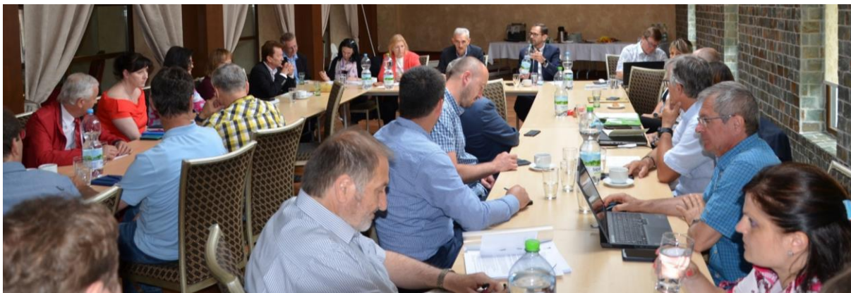
Obr. 2 Rokovanie zástupcov ÚGKK SR a KGK v Krakovanoch

V druhej časti boli prezentované aktivity komory. V následnej diskusii boli na programe témy verejného obstarávania geodetických a kartografických činností, programu 29. SGD, pripravovanej novely katastrálneho zákona, ďalšieho postupu na tvorbe smernice na GP a elektronizácia služieb v tejto oblasti, tvorba VKMi, riešenie podnetov prichádzajúcich na OKI a zodpovednosti AGK za svoje dielo, atď.